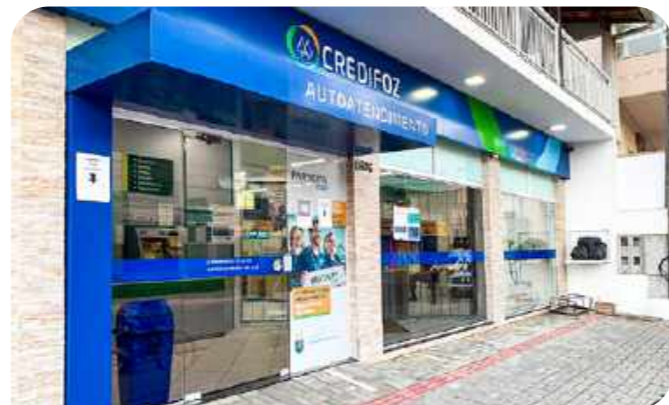
PA Gravatá - Av. Prefeito José Juvenal Mafra, 6905 Gravatá - Navegantes