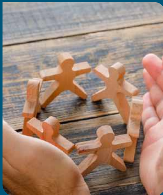
Banco de Imagens

Essa é a hora de contribuir para o futuro da Cooperativa, não fique de fora!