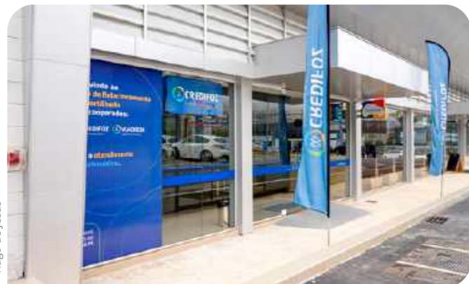
PA Praia Brava - Av. Oswaldo Reis, 2700 Santa Clara - Itajaí

completa. E, neste ano, esse modelo de parceria foi levado ao PA da Credifoz que fica na cidade de Navegantes, na praia de Gravatá. A intercooperação é importante para as cooperativas e para os cooperados, pois traz facilidade e comodidade para realizar todas as operações, como saques, pagamentos, transferências, entre outras.