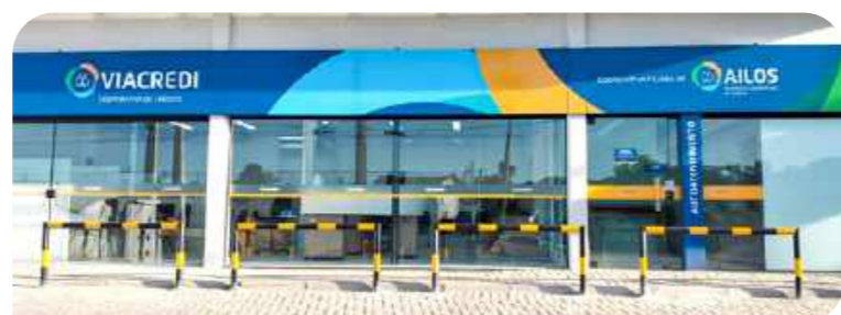
Viacredi inaugura novo Posto de Atendimento em Gaspar

Seguindo o propósito de ser um agente de desenvolvimento local, a Viacredi inaugura um novo Posto de Atendimento no município de Gaspar. A Cooperativa chega ao bairro Barracão, o que irá facilitar muito a vida dos cooperados da região, que possui diversas empresas. O novo PA fica na rua Lino Vicente Alberici, 1060, com horário de atendimento das 10h às 16h.